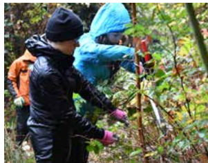
Cevi-Mitglieder beim Auslichten.