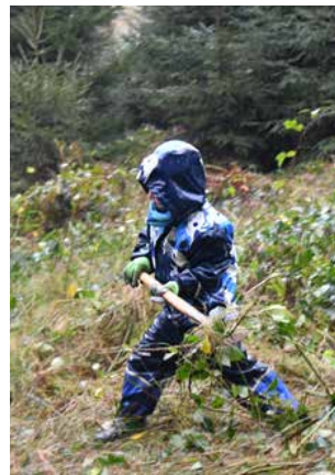
Mit vollem Einsatz am Werk.

Die über 160 Helferinnen und Helfer liessen sich vom strömenden Regen nicht abhalten.