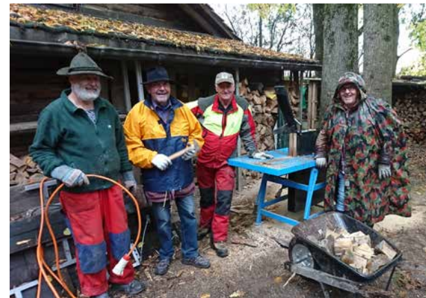
Mitglieder des Natur- und Vogelschutzvereins bei ihrem Vereinshaus im Schachen.

Die über 160 Helferinnen und Helfer liessen sich vom strömenden Regen nicht abhalten.