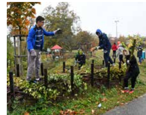
Arbeit an der Hecke beim Zelglischulhaus.

Es ist wunderbar, dass vielen Zuchlern unsere Grünflächen wichtig sind und sie sich dafür einsetzen.