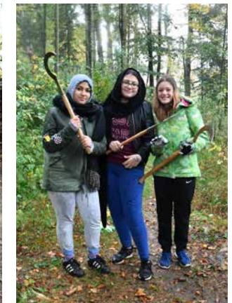
Oberstufenschülerinnen im Dittwald.