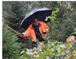
Ein Mitglied der Moschee.