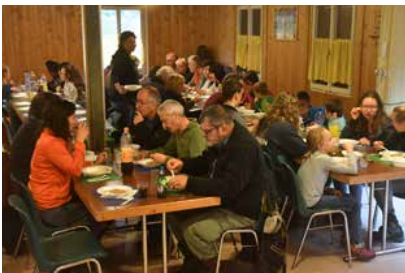
Zum Abschluss gabs ein feines Risotto.